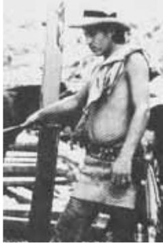
Atuendo tradicional del arriero: machete, poncho, delantal y sombrero.

Así, durante todo el movimiento comercial antioqueño, desde mediados del siglo XVI hasta el XIX, la arriería se convierte en el soporte de una gran circulación de productos. Abastece con mercancías a los pueblos, lleva productos de exportación a los centros de acopio o distribución, transporta mercancía importada, abastece los pueblos mineros, surte a fondas y tiendas.