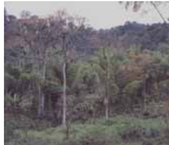
Paisaje al sur oriente de la cordillera Central, con Antioquia donde aún se conservan caminos de arrieros.