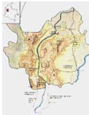
MAPA ESQUEMATICO DEL DESPLAZAMIENTO DE LA ARRIERA POR LOS DIFERENTES AUGES ECONOMICOS

El sangrero se fijó que todos llevaran su carriel, incluso él, que llevaba el que había sido de su abuelo. Quería ser buen arriero, y sin carriel no se podía. Llevaba la aguja de arria para remendar algún aparejo que se rompiera, o su ropa, pues nadie estaba libre de accidentes. Había echado un rollito de cabuya, clavos de herrar, martillo y tenazas... y hasta una botella de aguardiente de anís que había sacado de la tienda del tío sin que se diera cuenta. La verdad es que uno que otro traguito en el camino no le cae mal a nadie [...].