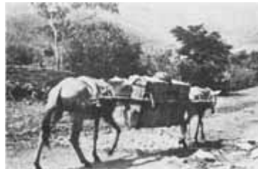
Las cargas, según su contenido y tamaño, se amarraban de esta manera a los caballos para recorrer los largos caminos de herradura.

Con el desplazamiento del comercio hacia el sur y el suroeste, el camino que atraviesa oriente empieza a prolongarse en una red infinita de caminos de herradura. La arriería se concentra entonces en esta zona, transportando café hacia Medellín y el Magdalena y abasteciendo estos nuevos pueblos, que empiezan a tener un elevado nivel de ingresos, comprando toda clase de artículos importados y producidos en el país.